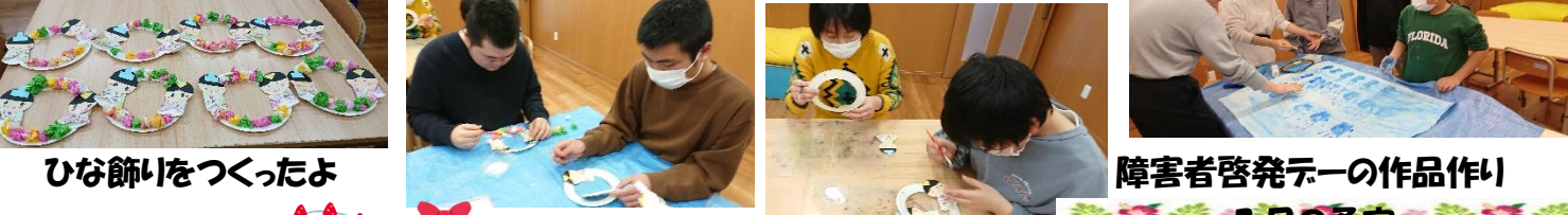
ひな飾りをつくったよ