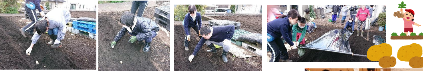
大きくなあれ、おいしくなあれ！