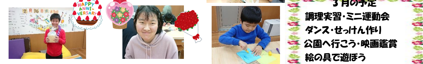
2月の誕生会おめでとう！ ごうでいんぐへようこそ！ 缶バッジ作り

3月の予定 調理実習・ミニ運動会 ダンス・せっけん作り 公園へ行こう・映画鑑賞 絵の具で遊ぼう お別れ会 など