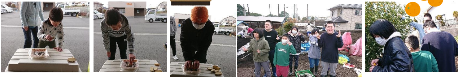
じゃがいもの灰付けをして・・・じゃがいもの植付けをやりました。