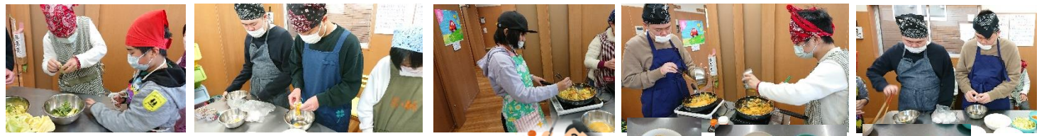
調理実習・おやつ作り(今月もたくさん作りました)